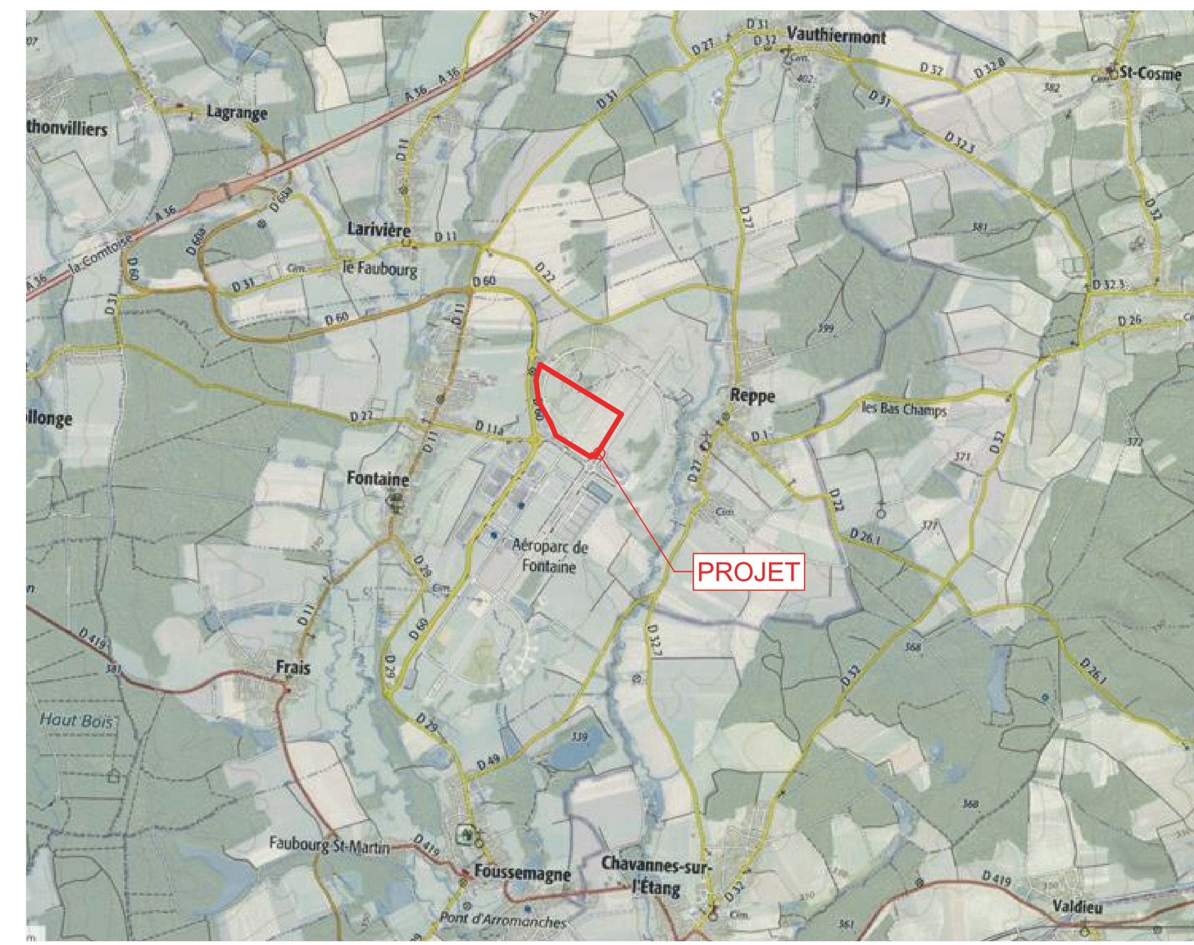
EXTRAIT CARTE IGN - PC - 1 / 25.000ème